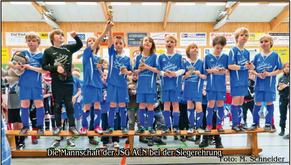
Die Mannschaft der JSg ACN bei der Siegerehrung