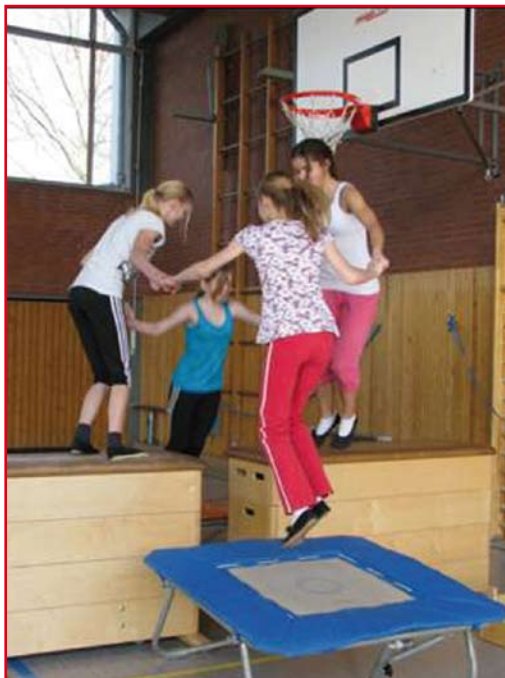
Minitramp zu viert...